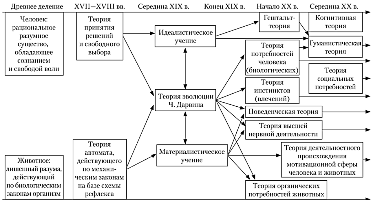
Рисунок 1. Схема, иллюстрирующая историю и преемственность в развитии теории мотивации

проблемой, вернее, главной задачей, которая перед этой наукой возникла. [3] Отсюда следует, что тема мотивации имеет длительную историю, начавшуюся с древнейших времен (см. рис.1).